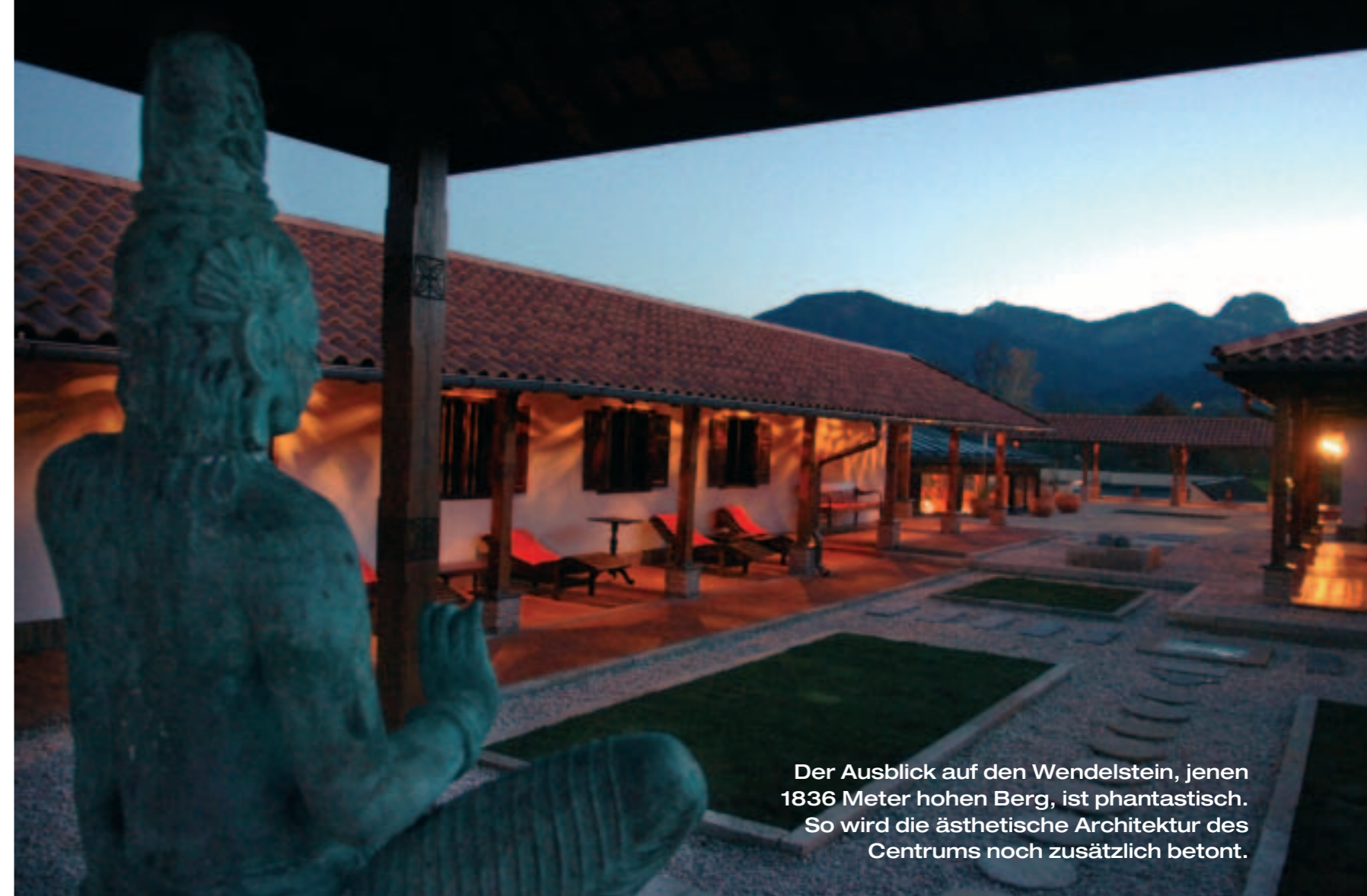
Der Ausblick auf den Wendelstein, jenen 1836 Meter hohen Berg, ist phantastisch. So wird die ästhetische Architektur des Centrums noch zusätzlich betont.

Ein ganz besonderer Genuss ist der traumhafte Ganzkörper-Ölguss, der die klingende Bezeichnung »Sharawanga-dara« trägt. Dabei wird der ganze Körper an bestimmten Stellen mit warmem Öl übergossen, das zart über die Haut rinnt. Dann erfolgt eine sanfte, wohltuende Einölung nach einem genau bestimmten Ablauf. Diese Massage öffnet die Entgiftungskanäle des Körpers und wirkt nicht nur auf der Körperebene, sondern auch auf der psychischen Ebene, da auch sie seelische Schlacken