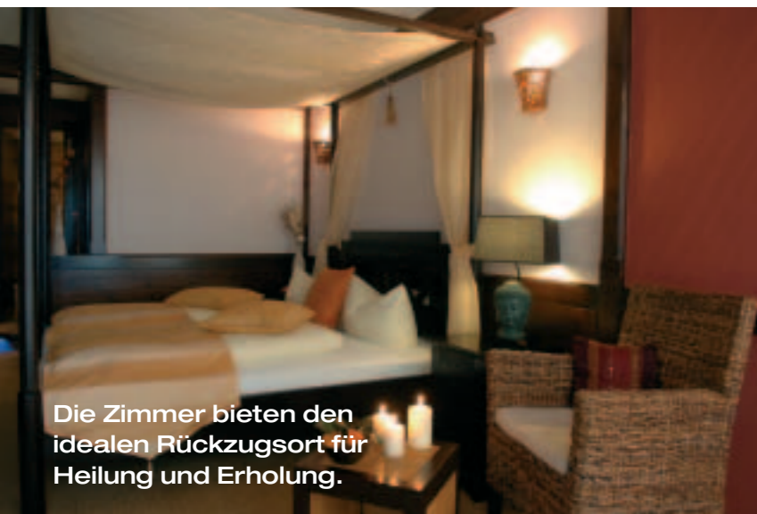
Die Zimmer bieten den idealen Rückzugsort für Heilung und Erholung.