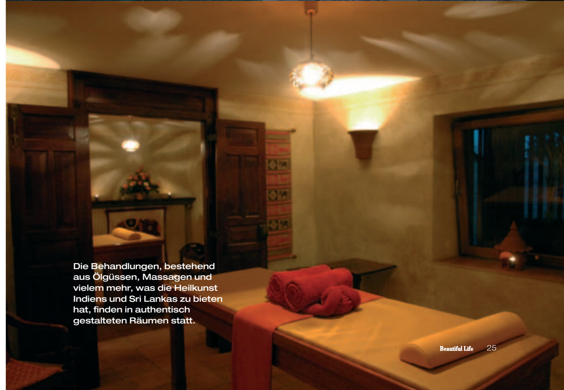
Die Behandlungen, bestehend aus Ölgüssen, Massagen und vielem mehr, was die Heilkunst Indiens und Sri Lankas zu bieten hat, finden in authentisch gestalteten Räumen statt.